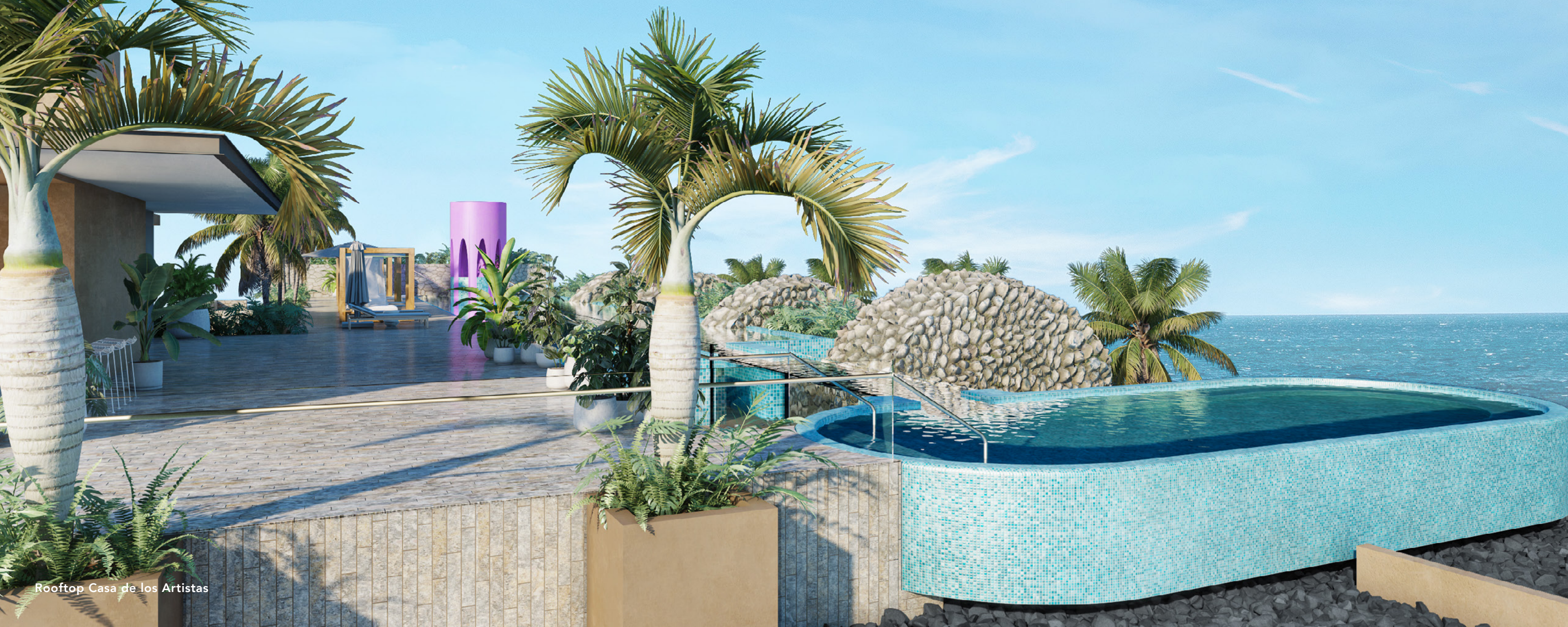
Rooftop Casa de los Artistas