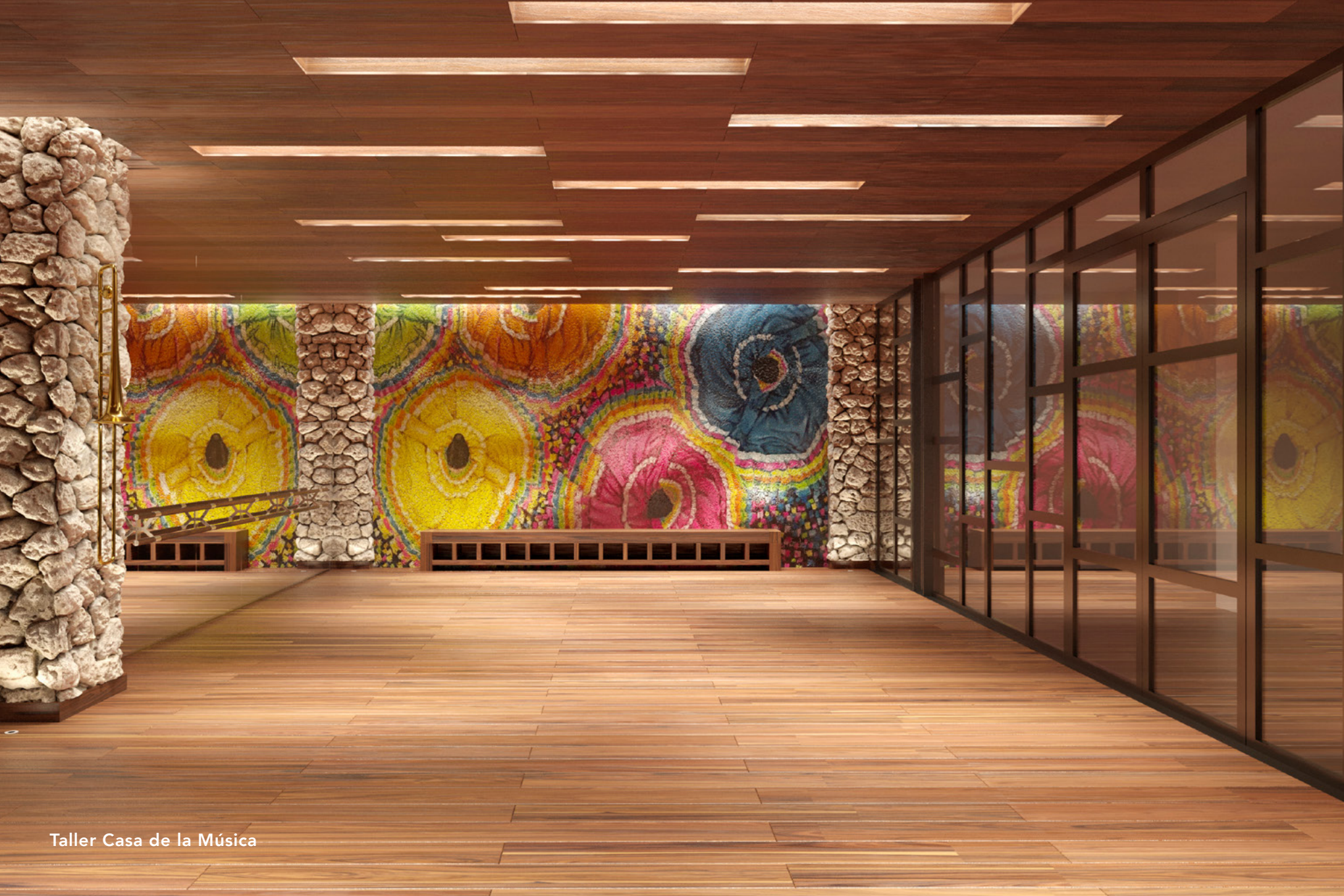
Taller Casa de la Música