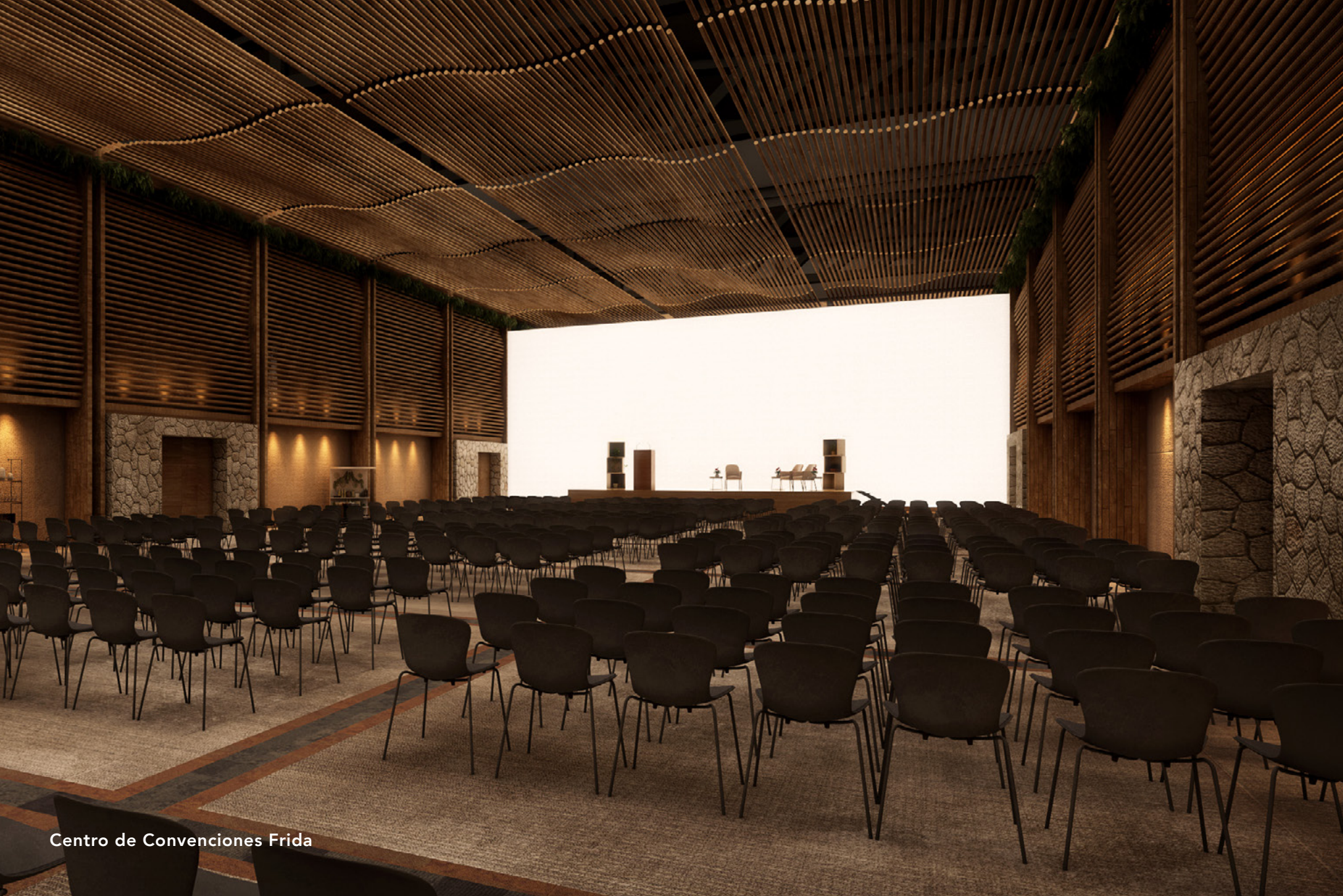
Centro de Convenciones Frida