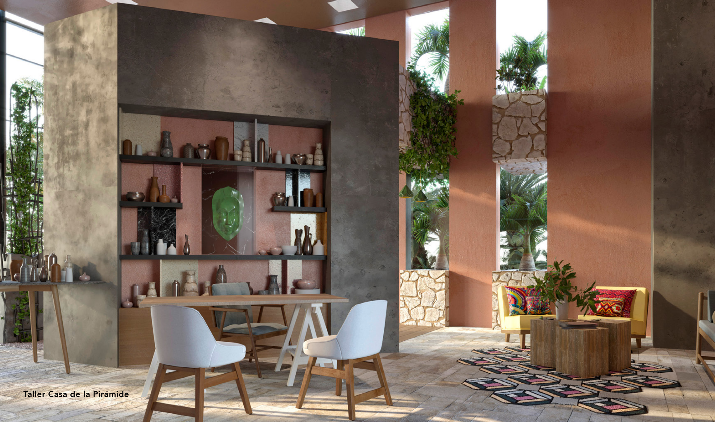
Taller Casa de la Pirámide