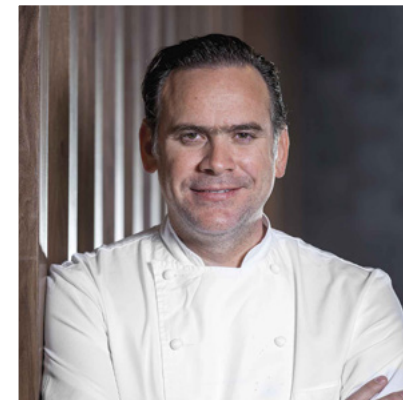
Cocina yucateca y libanesa a cargo del reconocido Chef internacional Roberto Solís , máximo exponente de la gastronomía de su natal Yucatán.