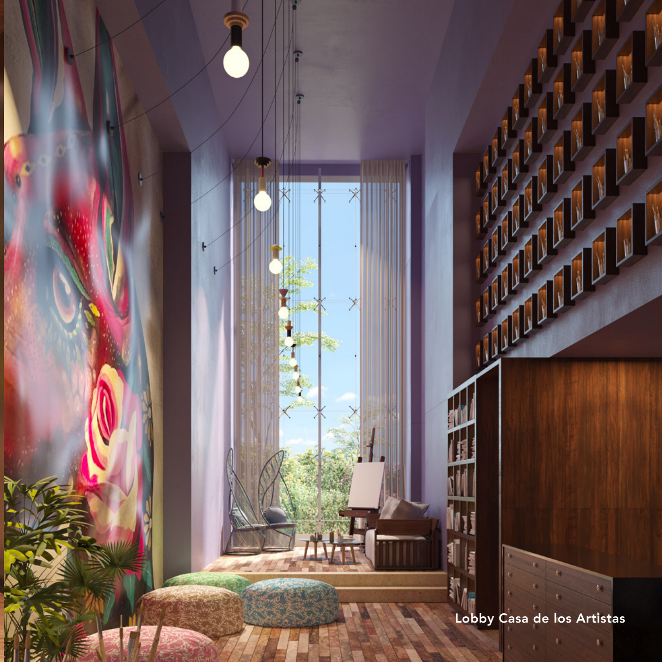
Lobby Casa de los Artistas