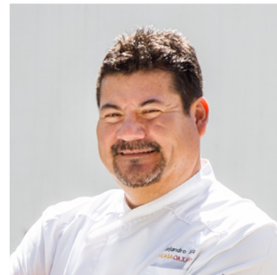
Cantina oaxaqueña por el Chef Alejandro Ruiz , portavoz fundamental del estado de Oaxaca.