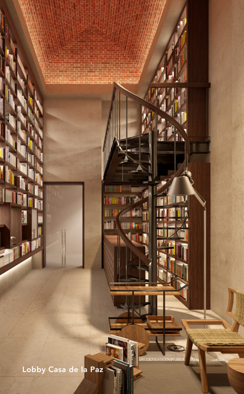
Lobby Casa de la Paz