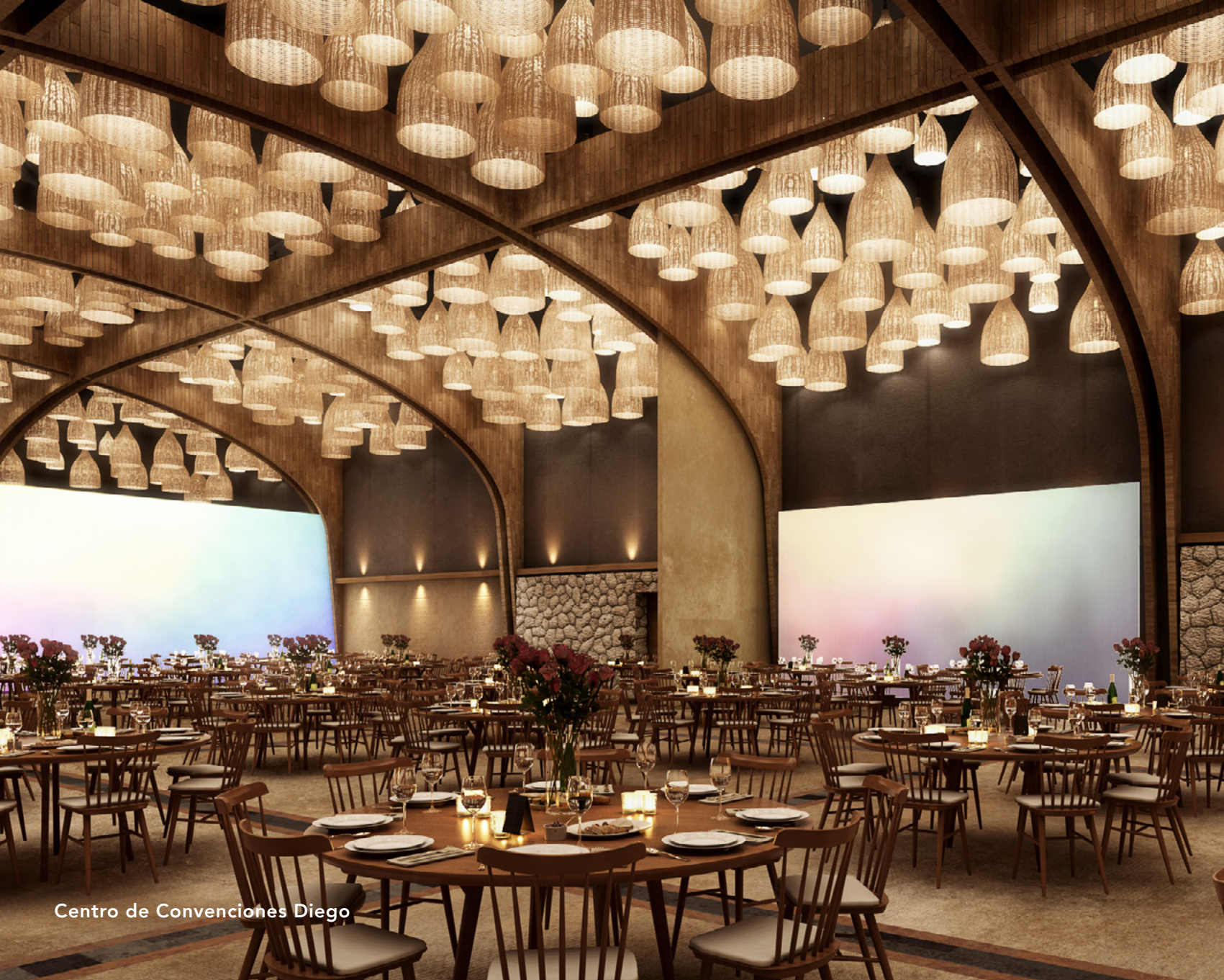
Centro de Convenciones Diego